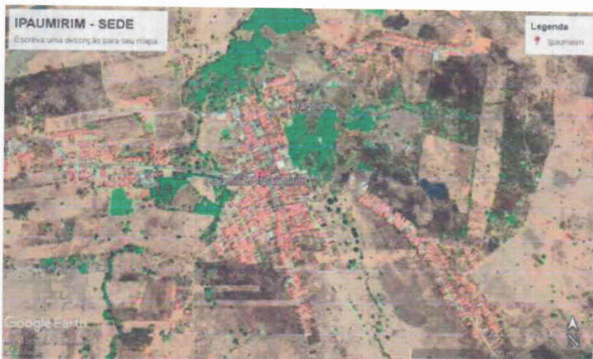
Figura 3 – Mapa de localização da cidade de Ipaumirim-CE: Distrito Felizardo