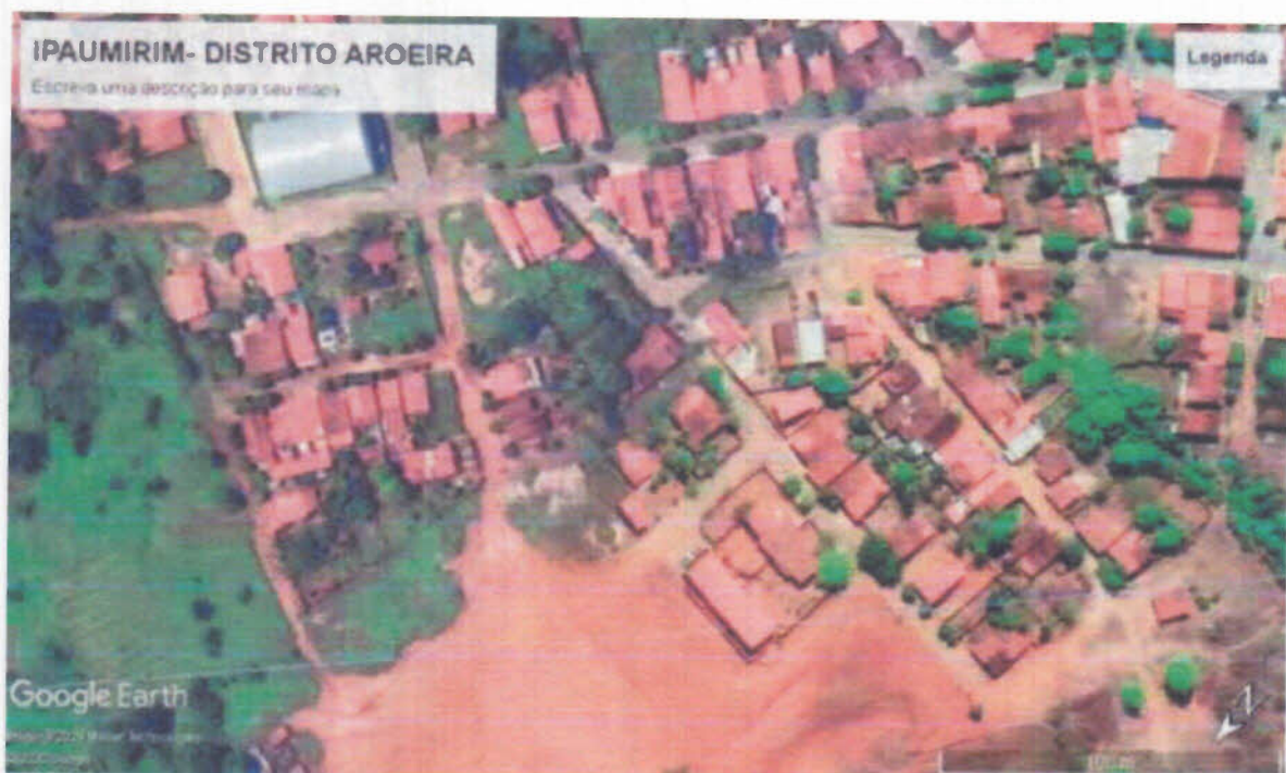
Figura 5– Mapa de localização da cidade de Ipaumirim-CE: Distrito