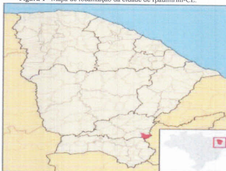
Figura 1– Mapa de localização da cidade de Ipaumirim-CE.

Ipaumirim está localizada no sul do estado do Ceará, mais precisamente na Latitude: 06° 47' 23" S, Longitude: 38° 43' 09" W 1 e altitude em relação ao mar de 273 metros, possuindo uma área de 286,2 Km 2 , como pode ser visto na Figura 10.