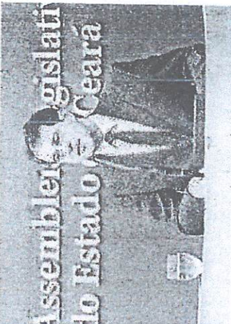
EVANDRO LEITÃO é presidente da Assembleia Legislativa do Ceará

Atual presidente da Assembleia Legislativa do Ceará, o deputado estadual reeleito Evandro Leitão (PDT) avalia que a maioria dos parlamentares eleitos pelo partido tem o interesse de integrar a base aliada do governo Elmano de Freitas (PT). "Eu sinto, converso com os deputados, meus colegas e sinto que a maioria que vir fazer parte da base governista", diz o deputado.